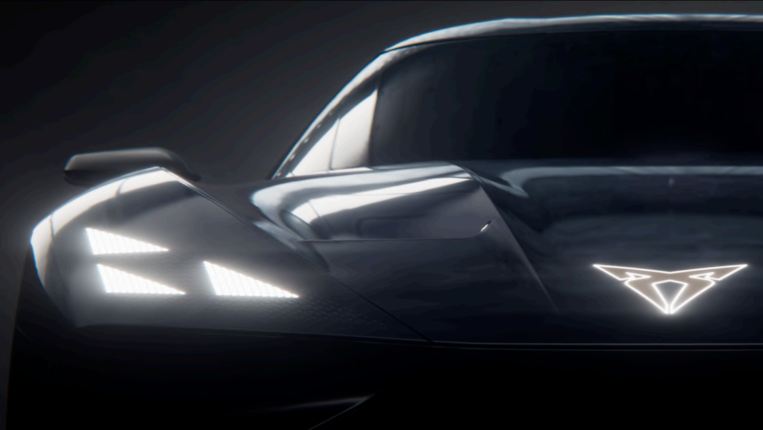
ESTILO DINAMISMO Y VELOCIDAD