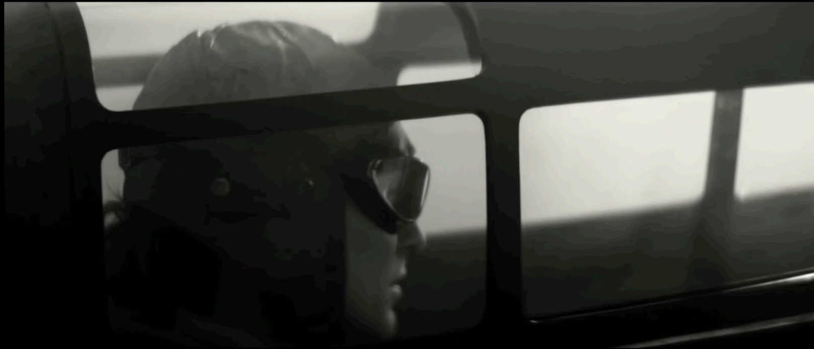
TRANSICIÓN POR CAMBIO DE COLOR

Cuando el Honda RA272 cruce del pasado al presente , romperá sutilmente una barrera temporal —como si atravesara un umbral invisible—.