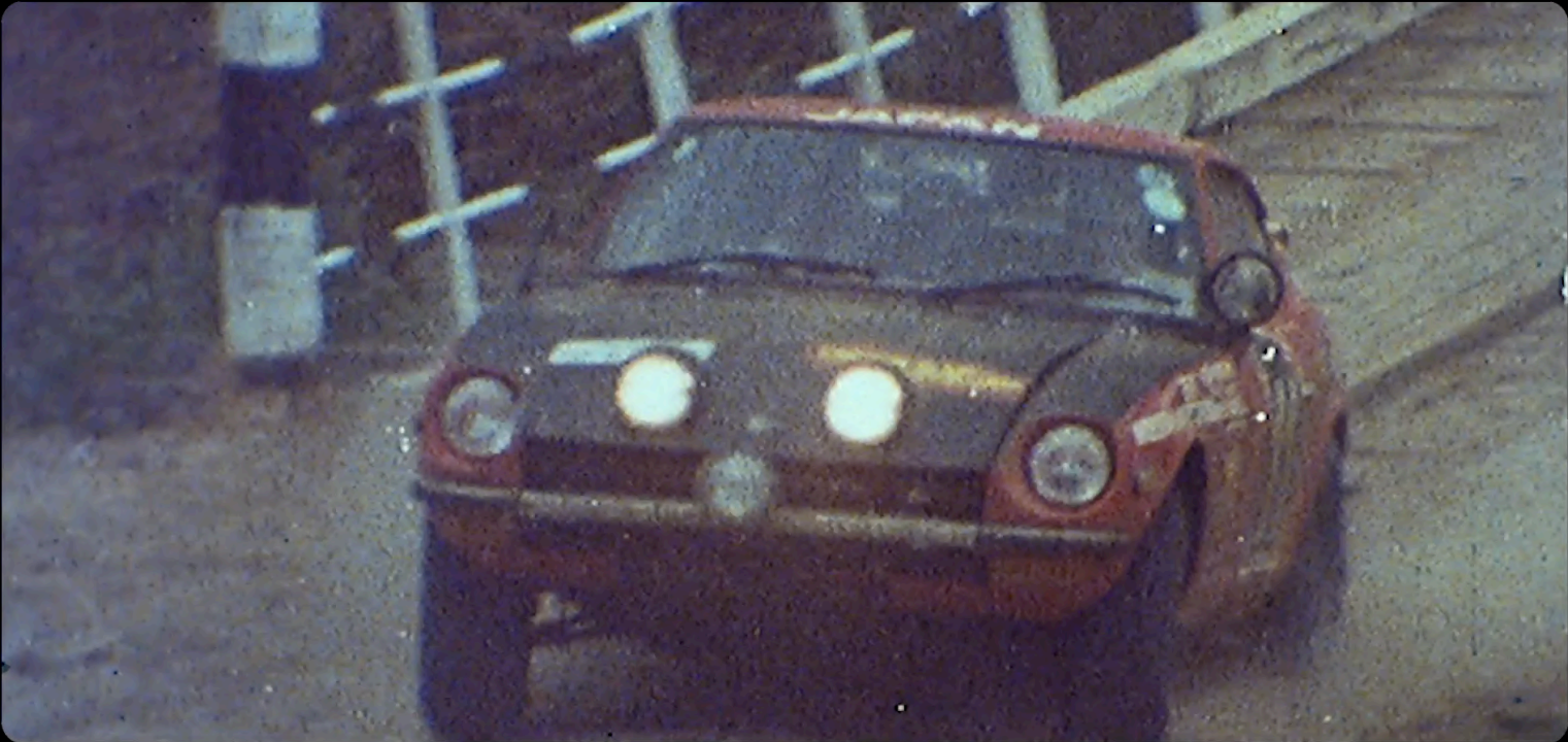
FORMATOS 35MM, 16MM Y SUPER 8MM

La utilización de diferentes formatos para la parte de época, como si hubiéramos insertado fotos antiguas e imágenes en 35mm, 16mm y super 8mm, que era con lo que se fotografiaba en esos años.