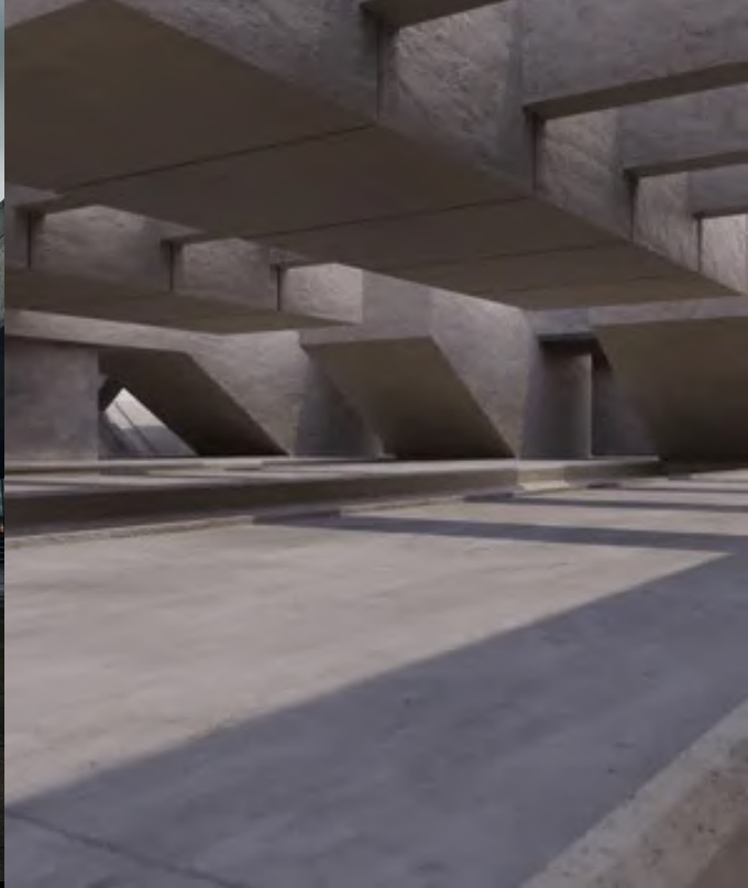
ARQ. BRUTALISTA PISTA