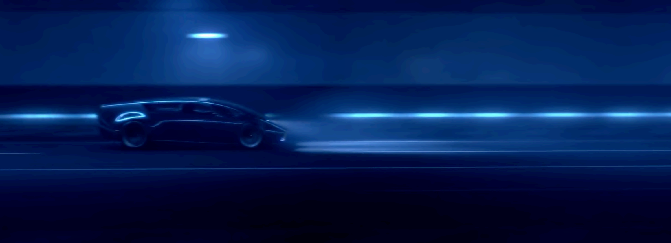
DISEÑO SALOON SERIE 0