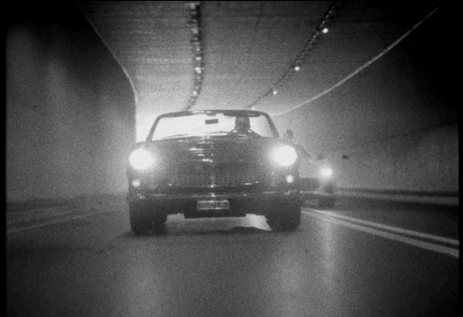
TRANSICIÓN POR ROMPIMIENTO DE MEMBRANA TEMPORAL A COLOR

El RA272 no solo cambia de época, abre camino al presente . Y detrás de él, la evolución de la línea Honda cobra vida.