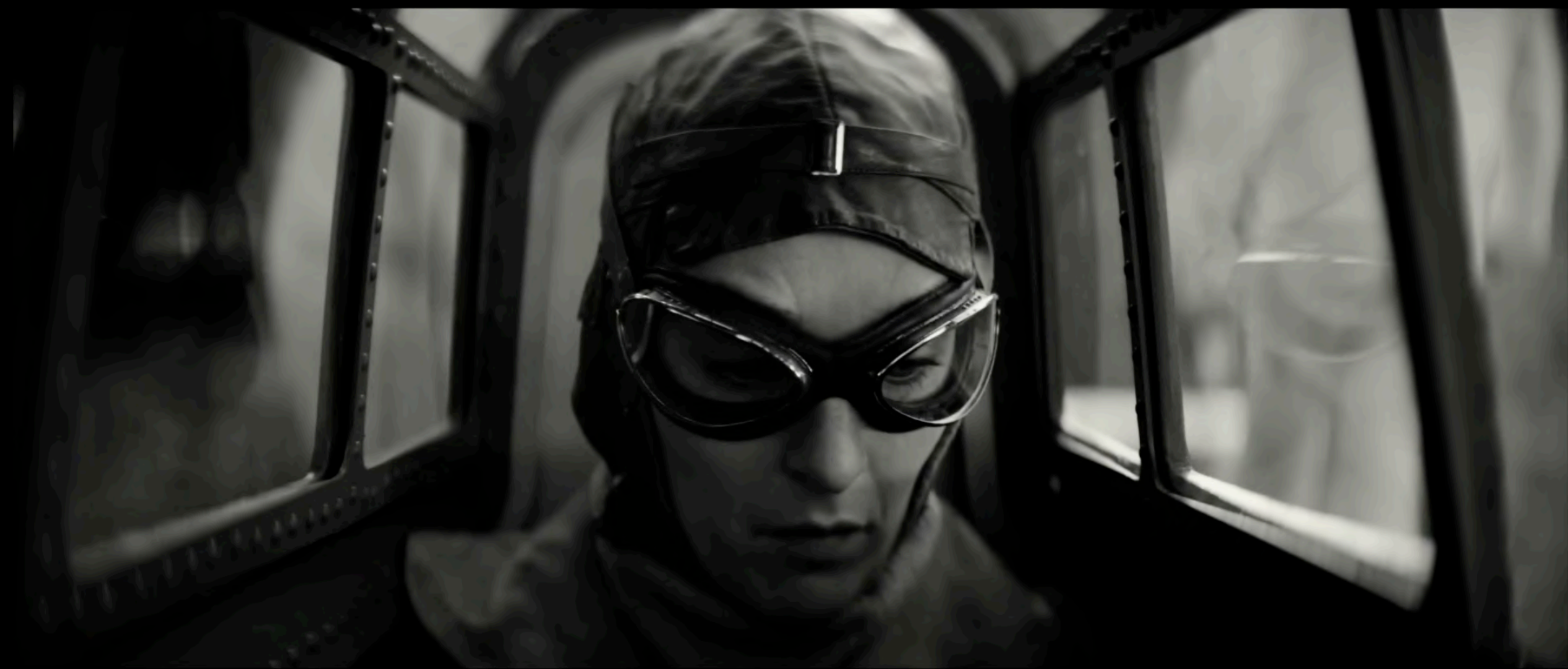
LENTES ANAMÓRFICOS COOKE Y MATERIAL EXTRA.

Para mostrar el pasado de Honda, arrancamos con una estética histórica: que narra el primer gran premio ganado por la marca, con textura de film viejo y formato clásico , aunado a running shots con Animación en AI adaptados a la época. De igual manera filmaremos elementos como de época, para generar shots en pits.